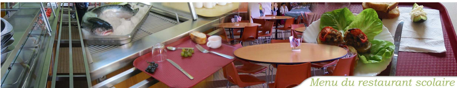
Menu du restaurant scolaire